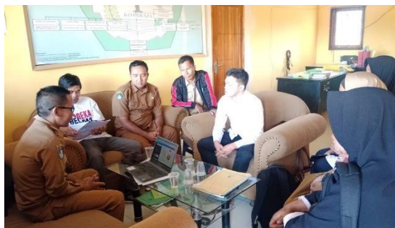
Gambar 01 Pendampingan individu (Diskusi Visi Guru Pengerak bersama teman sejawat dan kepala sekolah)

Selanjutnya, Nilai-nilai dan peran guru penggerak dapat diimplementasikan seperti melakukan refleksi bersama murid, menjadi coach bagi rekan guru, dan komunitas yang ada di sekolah CGP, serta menciptakan pembelajaran yang kreatif dan inovatif serta mengajar menggunakan teknologi.