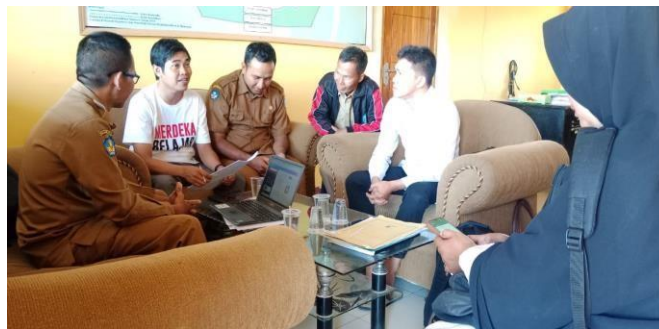
Gambar 02 kegiatan pendampingan individu

Rencana CGP kedepan bersama komunitas lainya akan menyusun modul penggunaan teknologi dan mengadakan work shop dalam mengembangkan kemampuan teknologi. Sasaran utama yaitu guru senior yang kurang mampu menggunakan teknologi.