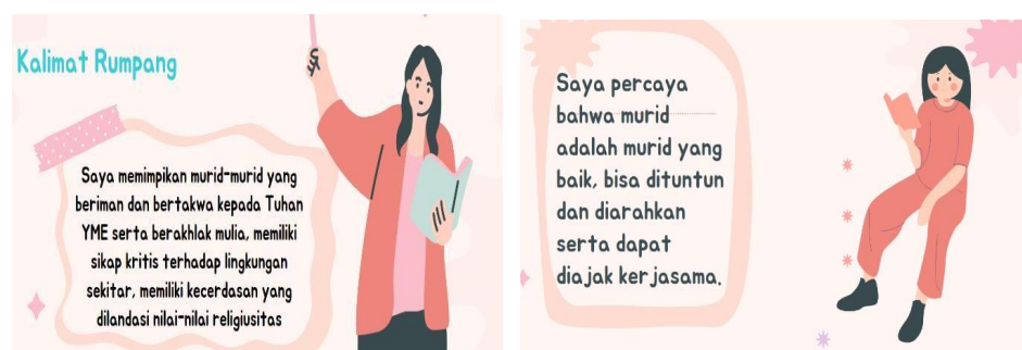
Gambar 4. Hasil isian kalimat rumpang

Pendampingan individu ini telah memberikan manfaat signifikan bagi guru penggerak serta proses pembelajaran di sekolah. CGP merasa termotivasi dan siap untuk mengimplementasikan perubahan yang telah direncanakan, yang merupakan indikasi positif dari efektivitas program. Saya sebagai pendamping merasa puas dapat memberikan kontribusi dalam pengembangan profesional CGP yang pada gilirannya berdampak positif pada siswa dan proses pembelajaran secara keseluruhan di SMKN 1 Kota Raja.